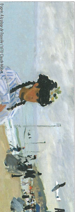
Dignes Au plage de Trouville (1870) Claude Monet

Mathieu Mercier, Drum and Bass (Stanley) , 2010, étagères, corde bleue, boîtes rouges, niveau à eau jaune, 200 x 86,8 x 20 cm. L'artiste, présenté à Bâle par la galerie Mehdi Chouaki (Berlin), se place en 19 e position de l'Artindex France.